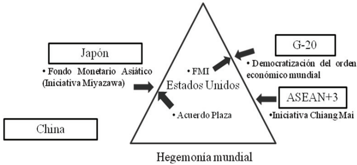
Figura 2 Dinámica de los actores, crisis financiera asiática 1997-1999

Fuente: elaboración propia con base en la presente investigación.