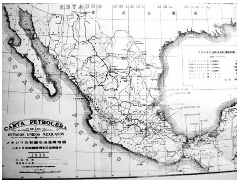
Mapa 4 Principales campos petroleros reportados por La Laguna

Otra probable inversión japonesa que se anunció fue la construcción de un oleoducto que uniría los océanos Atlántico y Pacífico, atravesando el Istmo de Tehuantepec, desde Minatitlán, Veracruz, hasta Salina Cruz, Oaxaca. La construcción de este oleoducto permitiría la exportación de petróleo hacia Japón de