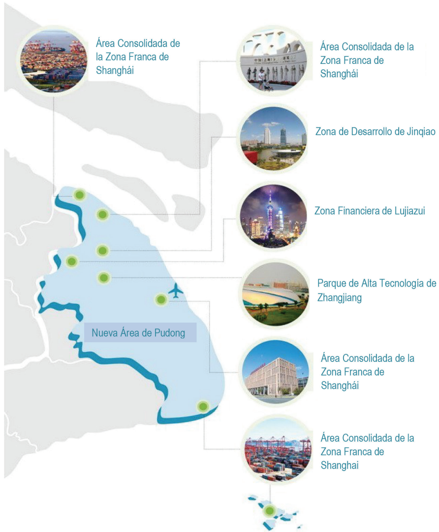
Figura 1 Mapa de la zona franca piloto de Shanghai China