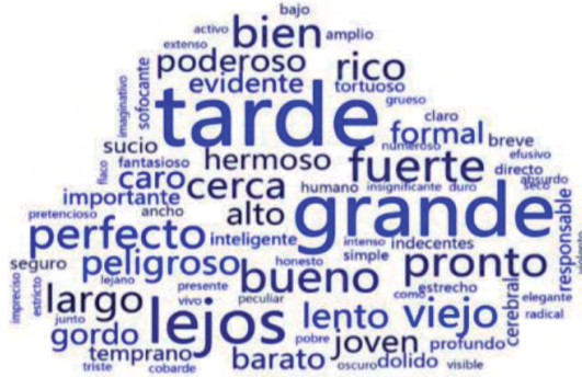
Figura 1 Nube de palabras