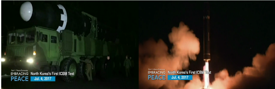
Figura 2 Pruebas de armamento norcoreano en julio de 2017