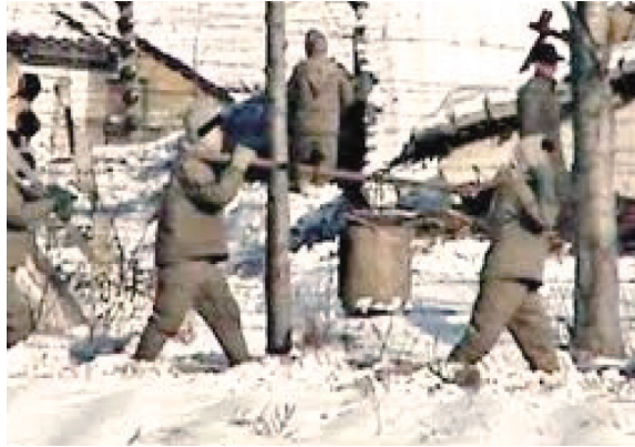
Figura 3 Prisioneros en un campo de concentración norcoreano